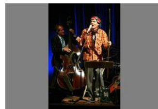
Carlsson kommer in på scenen, säger "Hej jag heter Carlsson", och folk skrattar. Då är det svårt att misslyckas.

Ledare Det svindlade till litet när jag i en tidningsartikel såg varifrån forskarna tror att våra hundar kommer: För uppåt 16