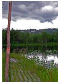
De natursköna omgivningarna vid Lintjärn är vackrast utan skräp.