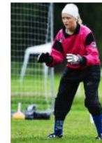
Målvaktsträning är inget för den med lite tålmod.